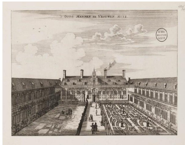
Het Oudemanhuis rond 1660.

Het Oudemanhuis, zoals het in de volksmond werd afgekort, gold als sjiek. Het gebouw was prachtig en het eten heel redelijk met afwisselend vleesdagen en vleesloze dagen. Precieze cijfers over het aantal bewoners ontbreken vaak, maar bekend is dat er in 1616 rond de tweehonderd 'oude arme mensen' woonden. Echt arm waren ze overigens niet. Van de bewoners werd verwacht dat ze meebetaalden aan de zorg. Meestal waren zij afkomstig uit de middenklasse. Rijke stedelingen sleten hun laatste levensdagen in de veel aangenamere proveniershuizen.