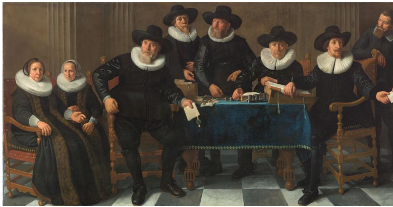
Oudemanhuisregenten in 1640, door C.C. Moeyaert.

Het Oudemanhuis, zoals het in de volksmond werd afgekort, gold als sjiek. Het gebouw was prachtig en het eten heel redelijk met afwisselend vleesdagen en vleesloze dagen. Precieze cijfers over het aantal bewoners ontbreken vaak, maar bekend is dat er in 1616 rond de tweehonderd 'oude arme mensen' woonden. Echt arm waren ze overigens niet. Van de bewoners werd verwacht dat ze meebetaalden aan de zorg. Meestal waren zij afkomstig uit de middenklasse. Rijke stedelingen sleten hun laatste levensdagen in de veel aangenamere proveniershuizen.